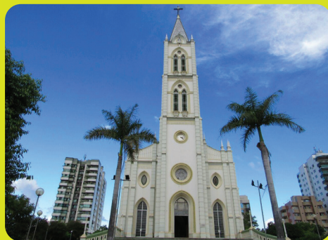
Paróquia Nossa Senhora do Bom Despacho

A Praça Olegário Maciel é considerada um dos bens arquitetônicos do local, onde as pessoas podem relaxar e aproveitar feiras e eventos. Outro cartão-postal da cidade é a Paineira da Santa Casa, uma das árvores mais belas de Bom Despacho.